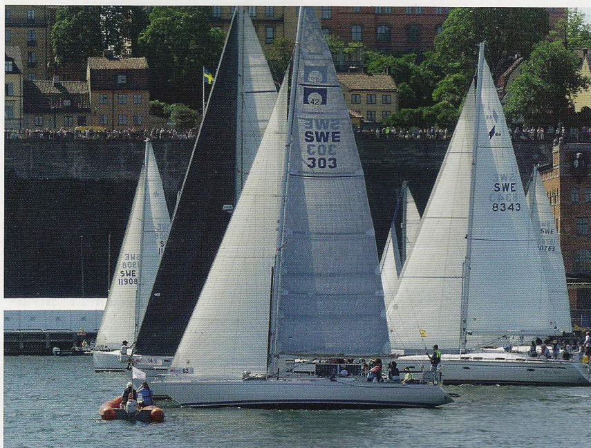
Omega 42 SWE 303 Anandra

När man gör nya bekanskap och berättar om att ens stora intresse är segling och att man kappseglar rätt mycket så får man ofta frågan om man seglat Gotland Runt (eller ÅF Offshore Race som det numera heter – Men som 2020 officiellt tar tillbaka namnet Gotland Runt igen, Red.:s anm).